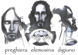
preghiera elemosina digiuno